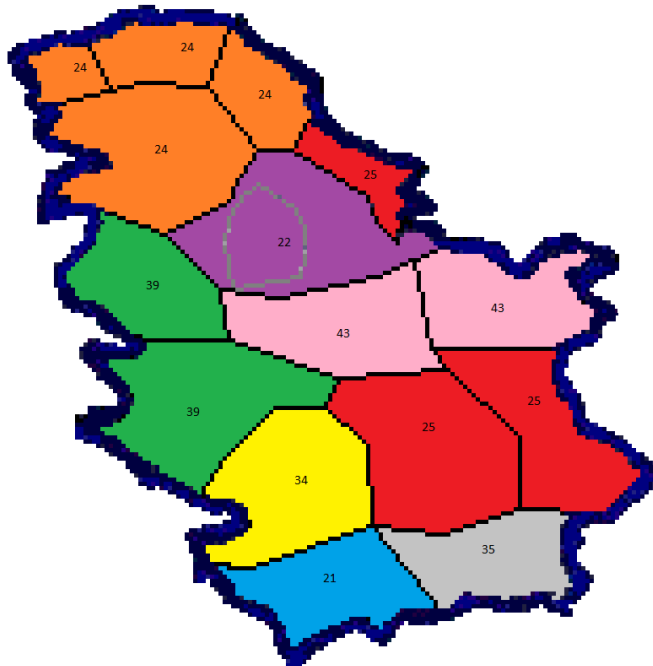
Мрежа MUX 1